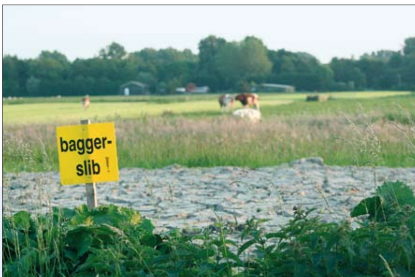
Bagger op de kant; in landelijk gebied meestal geen probleem.

Watergangen moeten door Rijnland en andere onderhoudsplichtigen op diepte worden gehouden volgens de bepalingen in de 'legger'. Dit is de laatste twintig jaar echter niet voldoende gebeurd. Hierdoor is de hoeveelheid vrijkomende bagger onevenredig hoog. In dit geval moet meer bagger worden verspreid dan wat volgens Artikel 4 van de Keur van Rijnland onder "behoorlijk onderhoud" wordt verstaan. Rijnland onderzoekt of de bestaande regelgeving ruimte biedt om landeigenaren hiervoor te compenseren.