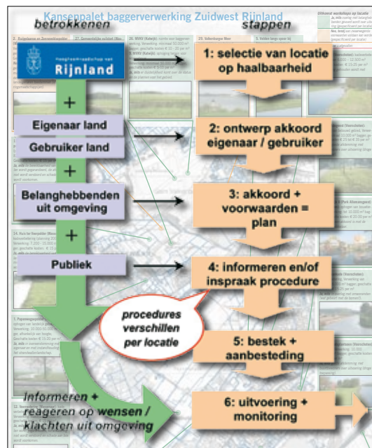
Baggerverwerking Rijnland Zuidwest fase II: Rol van belanghebbenden in de 6 stappen tot aan uitvoering.

In sommige gevallen is een vergunning voor de wet Milieubeheer nodig waarbij inspraak mogelijk is op de zogenoemde ontwerp-beschikking die ter inzage ligt op het gemeentehuis (stap 4). In alle gevallen zal via nieuwsbrief, website en lokale nieuwsbladen bericht worden over de locatieplannen. De verwachting is dat in de loop van 2008 voor een